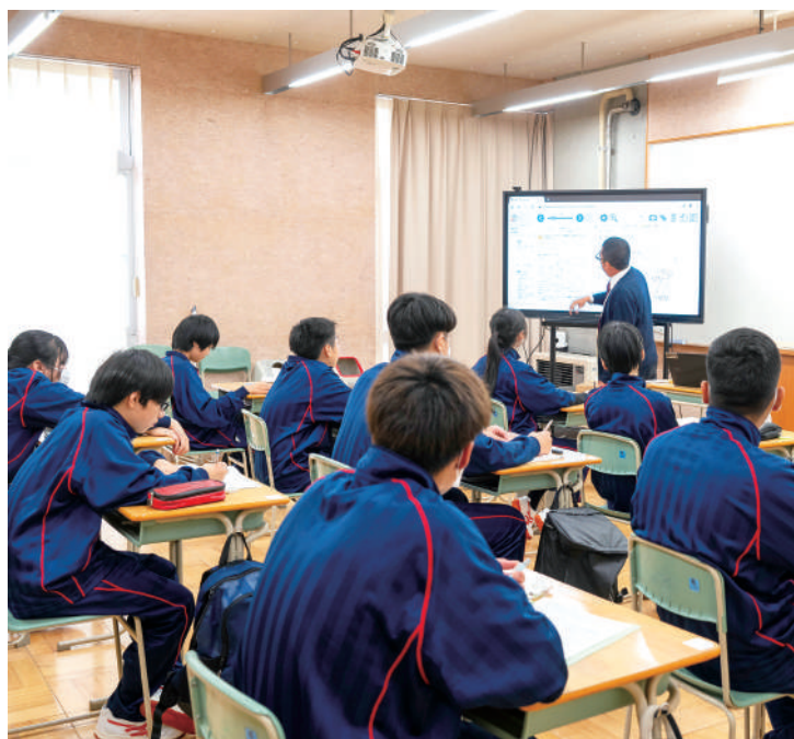
定時制教室での授業風景