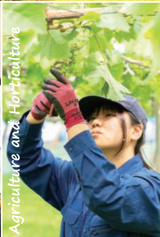
Agriculture and Horticulture