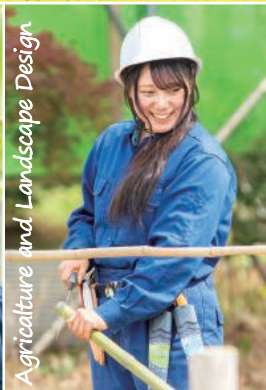
Agriculture and Landscape Design